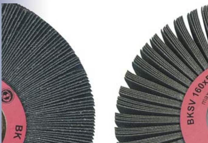
Detail lamel BK